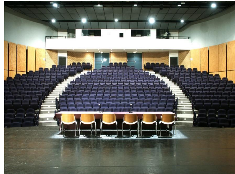
Amphithéâtre Agora - BOULAZAC