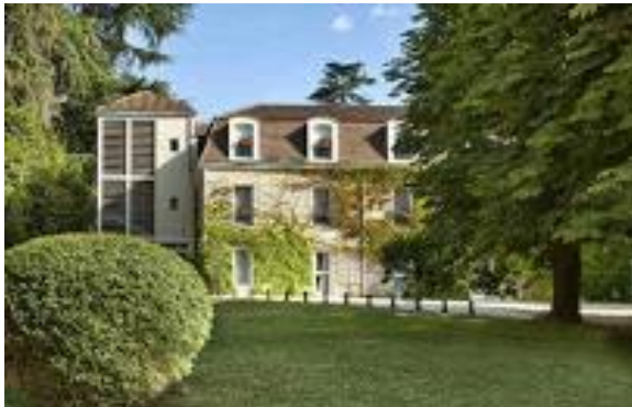
L'ORANGERIE DU CHÂTEAU DES REYNATS