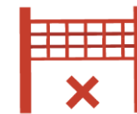
Poteaux de sport