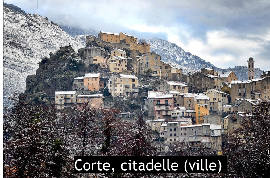
Corte, citadelle (ville)