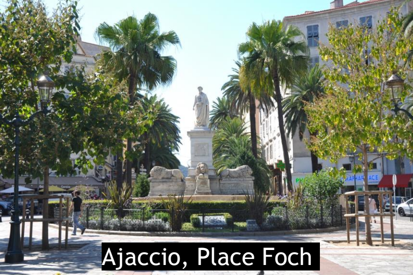
Ajaccio, Place Foch