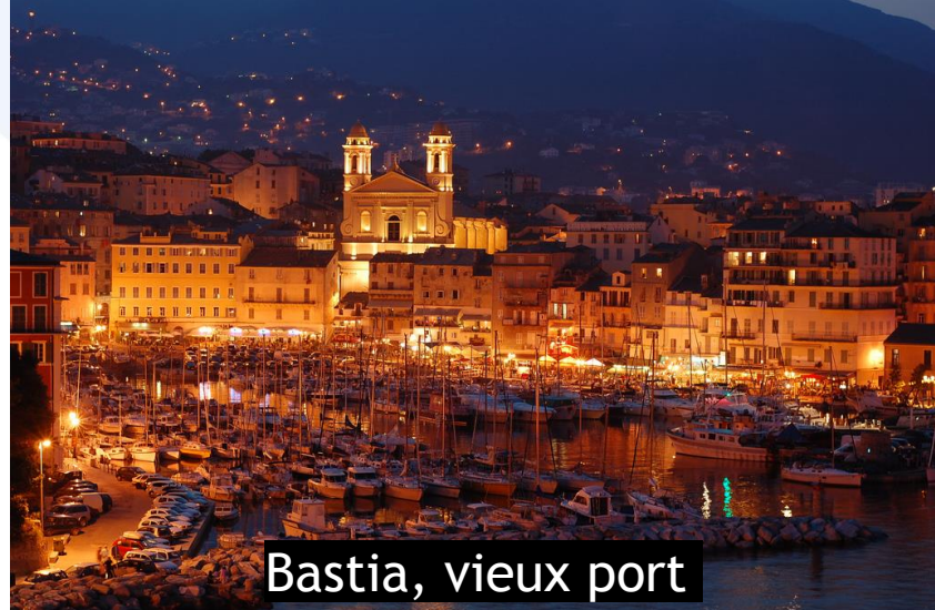
Bastia, vieux port

La Ligue Corse de Volley-Ball vous souhaite un agréable séjour sur l'Ile de Beauté