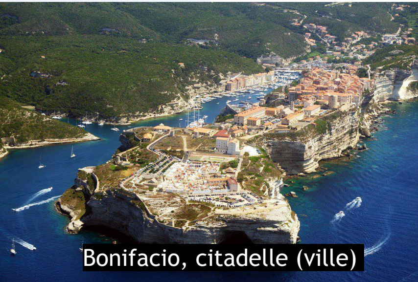
Bonifacio, citadelle (ville)